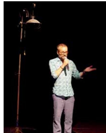
Le lampadaire à roulette